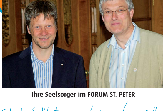
Ihre Seelsorger im FORUM ST. PETER